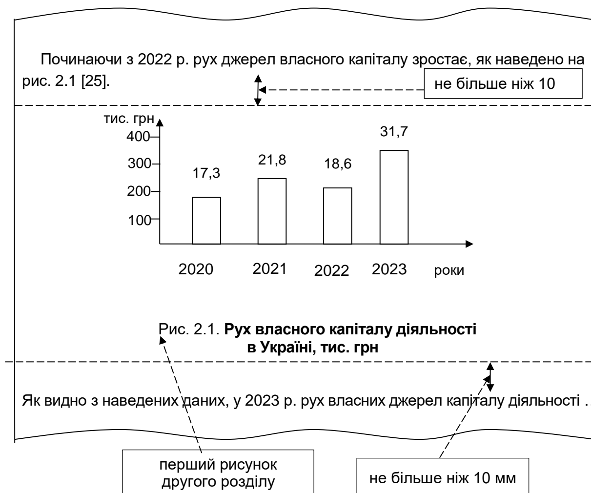
Рис. 3. Наочне подання оформлення ілюстрацій у курсовій роботі

Ілюстрації та таблиці в курсовій роботі необхідно подавати безпосередньо після тексту, де її згадано вперше, або на наступній сторінці. Ілюстрації позначають словом "Рис." і нумерують послідовно в межах розділу, за винятком ілюстрацій, поданих у додатках (рис. 3).