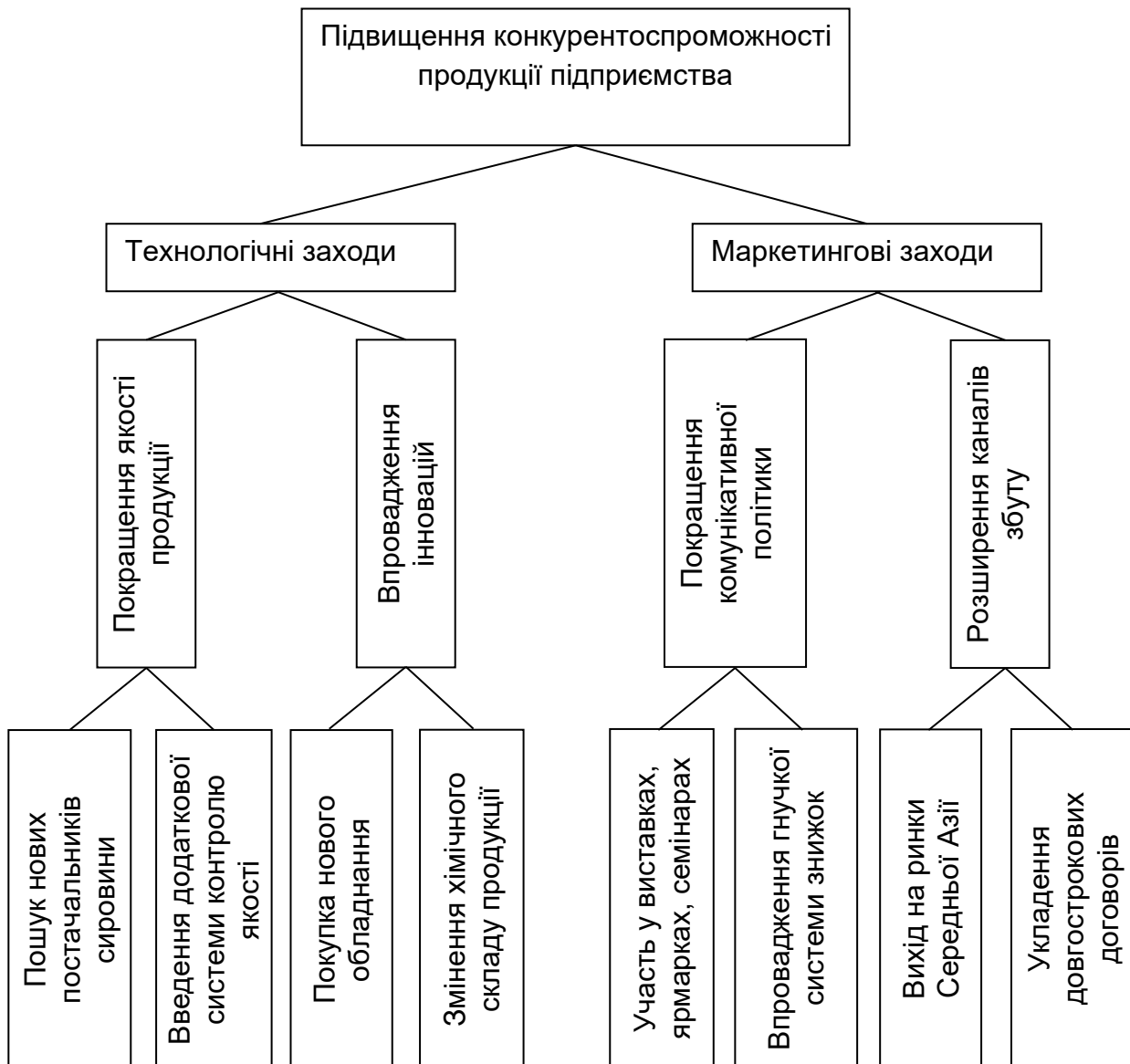
Рис. Г.1. Дерево цілей щодо підвищення конкурентоспроможності продукції

Дерево цілей проекту, що спрямований на підвищення конкурентоспроможності продукції підприємства з виробництва скляної продукції, представлено на рис. Г.1.