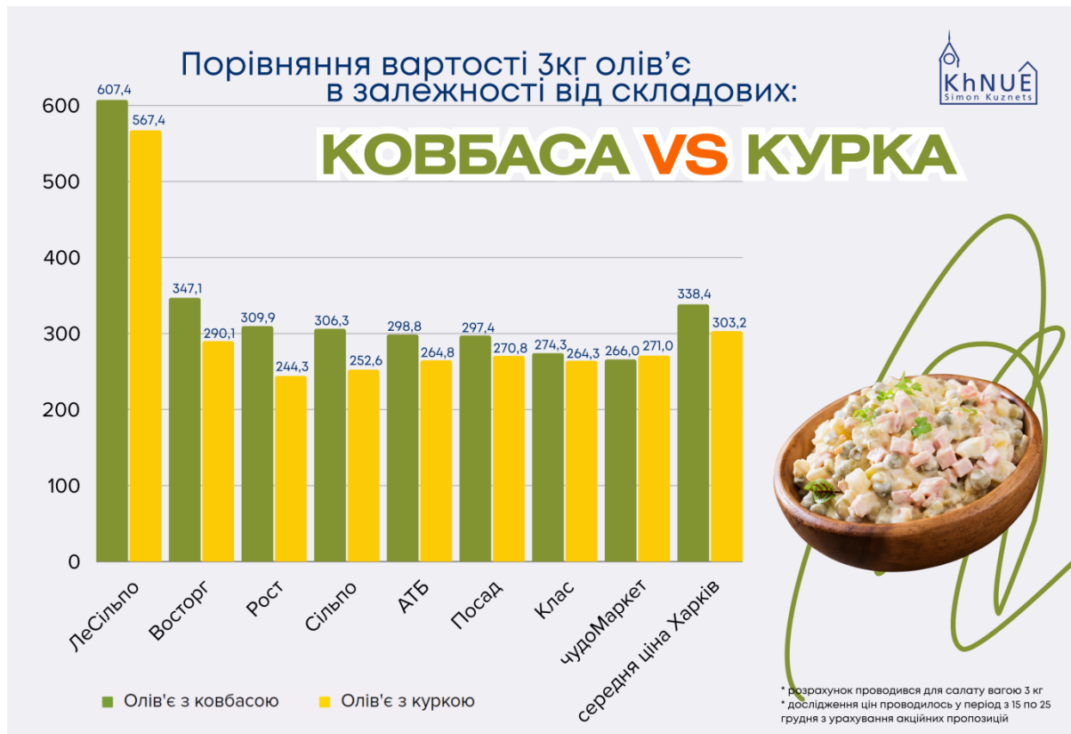
Рисунок. Динаміка цін за різними торговельними мережами на продукти, які входять до складу салату "Олів'є" (столичний). Розрахунок проводили для салату вагою 3 кг.

Зокрема, найдешевший салат у Харкові можна приготувати із продуктів, придбаних у "Чудо Маркеті". Найдорожча вартість "Олів'є" в місті – у супермаркеті "Le Silpo" (динаміка цін наведена на рисунках).