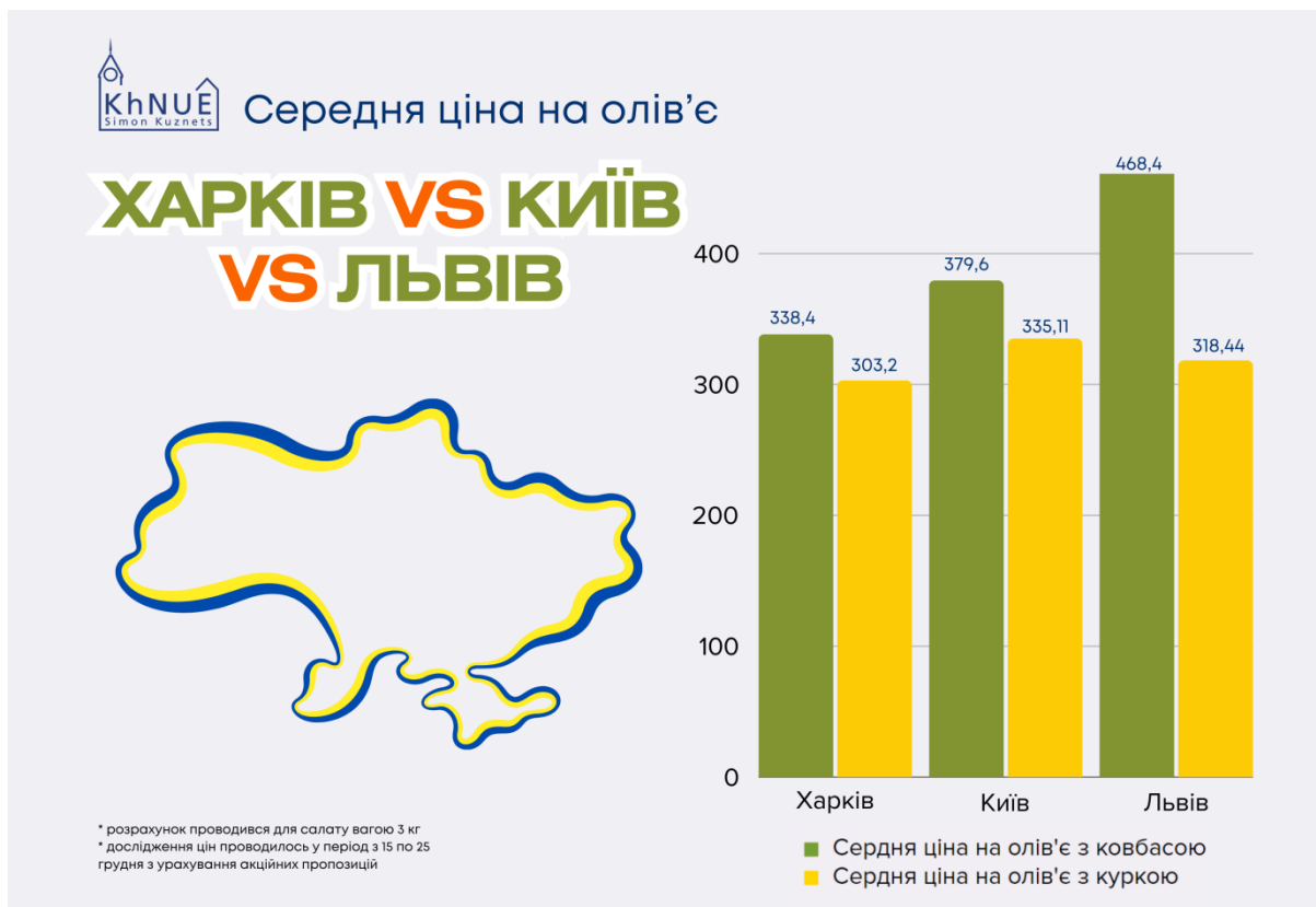
Рисунок. Середня вартість набору продуктів у різних містах України, які входять до складу салату "Олів'є" (столичний), розрахунок проводили для салату вагою 3 кг

Серед інших обласних центрів найдорожчими містами виявилися Львів та Київ. Там вартість салату склала 468 грн. та 379 грн. Трійку найбюджетніших очолює Кременчук. За ним ідуть Ужгород та Харків з вартістю 325 грн., 327,54 грн. та 338,4 грн.