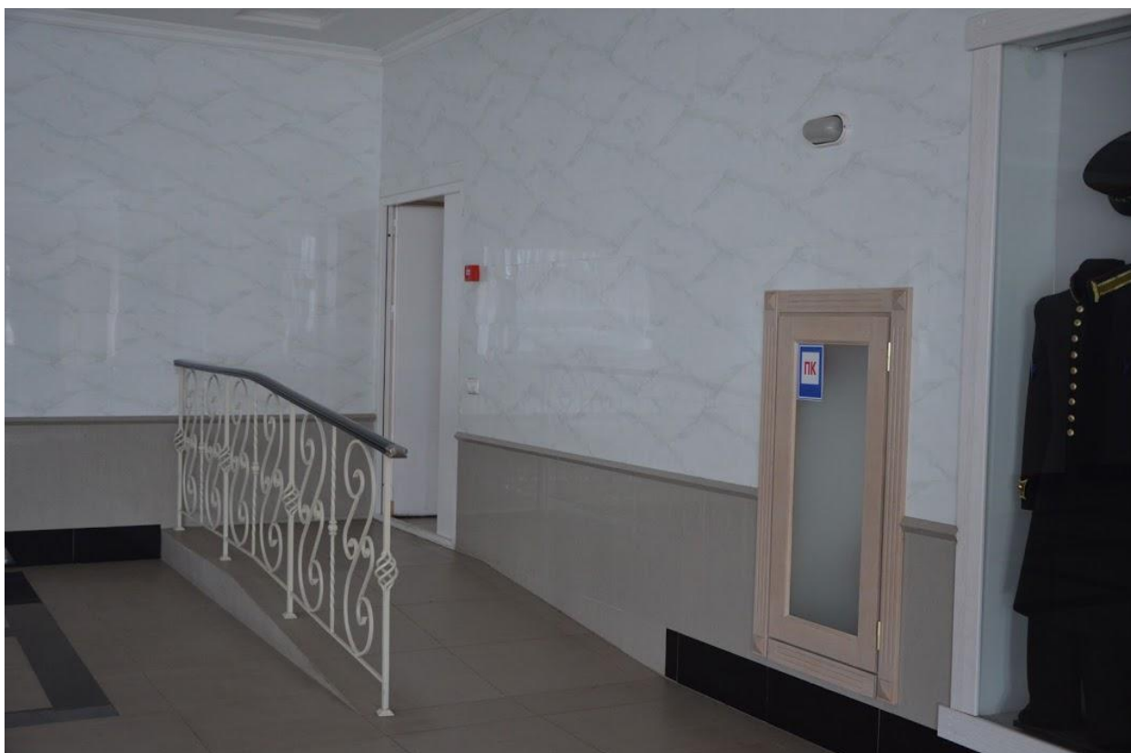
Рис. 5 Новий корпус, третій поверх