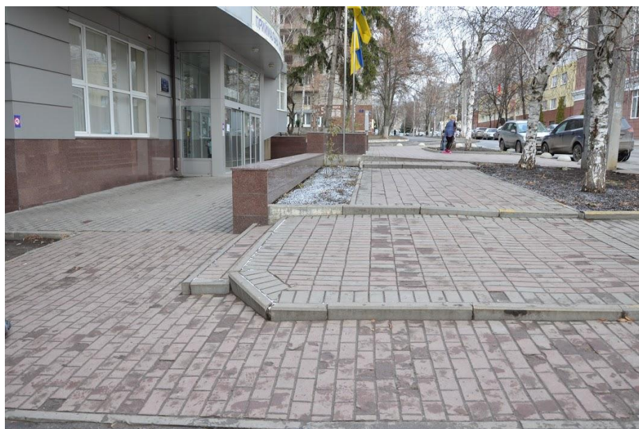
Рис. 1. Науково-бібліотечний корпус

https://www.youtube.com/watch?v=LySy5ayV0ms