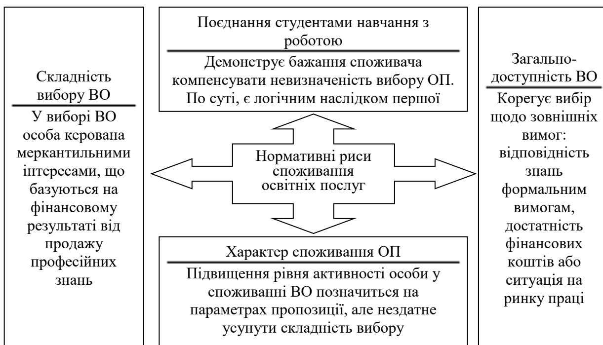
Рис. 2. Нормативні риси споживання послуг вищої освіти

У роботі систематизовано нормативні риси споживання освітніх послуг, особливості яких полягають в урахуванні діалектичної єдності особистих інтересів споживачів і затребуваності їхніх професійних знань та умінь роботодавцями на основі складної природи вибору ЗВО, поєднання навчальної та трудової діяльності, загальнодоступності ЗВО, високого рівня активності споживання освітніх послуг. Позичування споживачів у системі координат СВО доводить, що їх участь у реформах не є умовою їх успішності. Нормативні риси поведінки споживачів вирізняються різноманітністю аспектів дій і єдністю суті, яка передбачає підпорядкування інтересів особистості інтересам суспільства та бізнесу. Особливості поведінки споживачів досліджено окремо, а разом вони складають цілісну картину, яка оцінює їх здатність до самостійних дій з урахуванням реалій ринку (рис. 2).