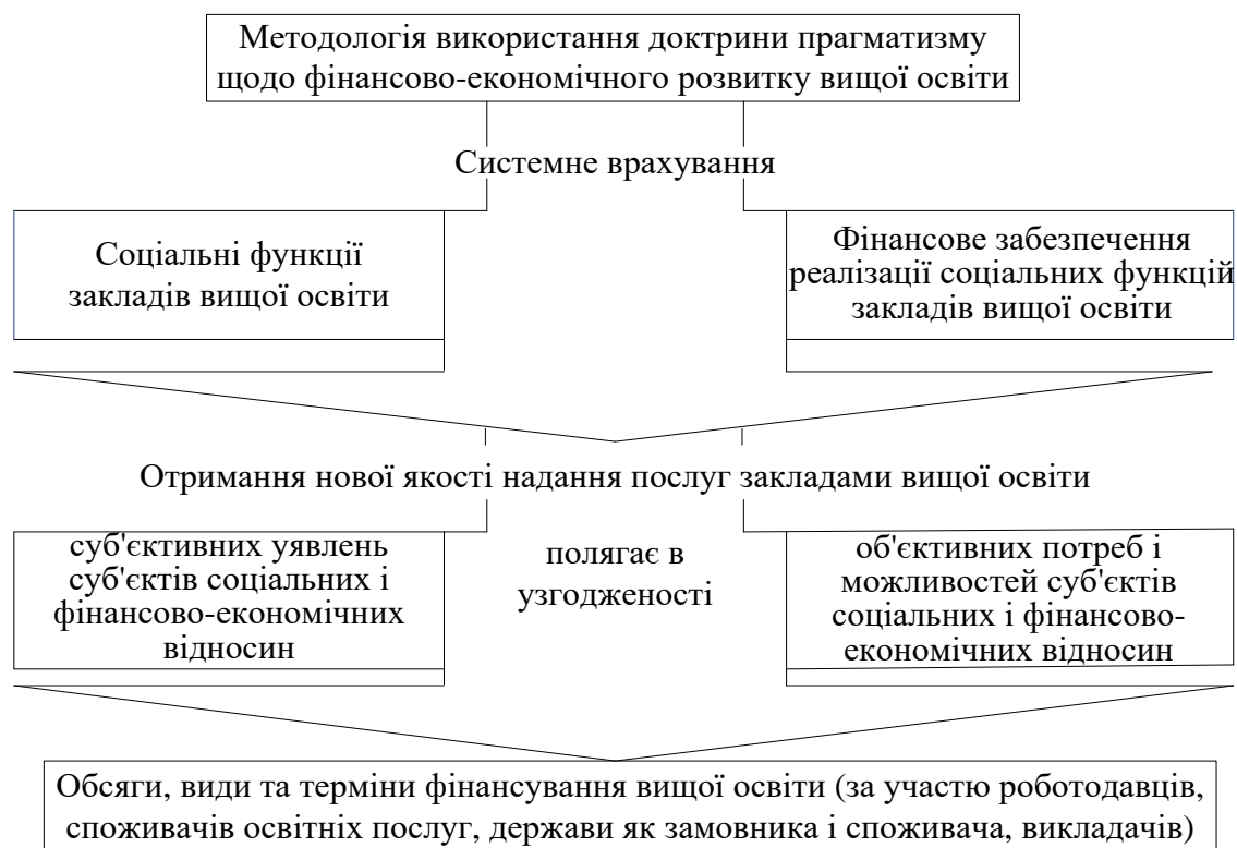
Рис. 1. Методологічне підґрунтя фінансово-економічного розвитку вищої освіти на засадах прагматизму

У дисертації обґрунтовано методологію фінансово-економічного розвитку ВО щодо використання концепції прагматизму. Методологія передбачає комплексне та системне врахування соціальних функцій ЗВО, що ґрунтується на принципах, методах, моделях реальних соціальних умов розвитку ВО та адекватного фінансового забезпечення їх реалізації для отримання нової якості надання послуг ВО (рис. 1).