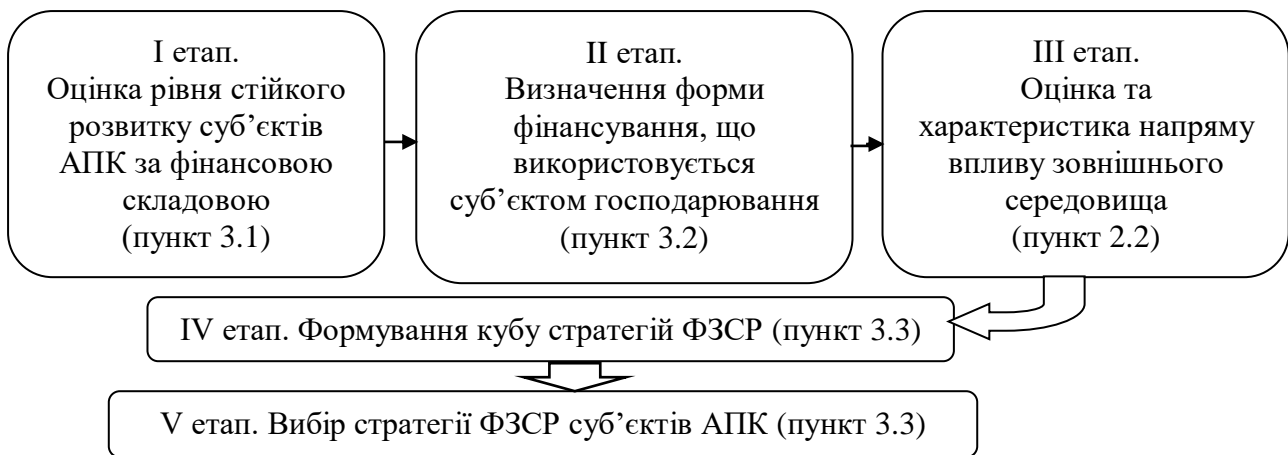
Рис. 2. Етапи методичного підходу до вибору стратегій формування ФЗСР суб'єктів АПК

Для вибору суб'єктом АПК адекватної стратегії ФЗСР залежно від рівня його розвитку, форми фінансового забезпечення та з урахуванням впливу зовнішнього середовища, пропонується використання куба стратегій формування ФЗСР (рис. 3).