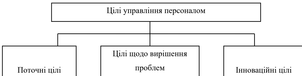
Рис. 1.2. Цілі управління персоналом

Усі ілюстрації, незалежно від того, чи є вони графіками, діаграмами, діаграмами тощо, позначаються словом «Рис.» з великої літери та послідовною нумерацією в межах розділу, за винятком рисунків, поданих у додатках. Більшість малюнків повинні містити номер розділу та порядковий номер, крапку між ними. Підписи до рисунків послідовно розміщуються виключно під малюнком. Номер малюнка та підпис відокремлюються крапкою, наприклад «Рис. 1.2. Цілі управління персоналом». Приклад малюнка представлений нижче.