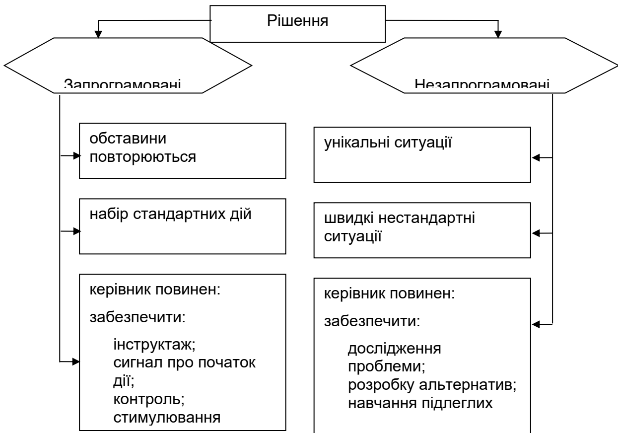
Рис. 3.2. Рішення за ступенем зумовленості [1]

Розрізняють такі підходи до сприйняття [1]: