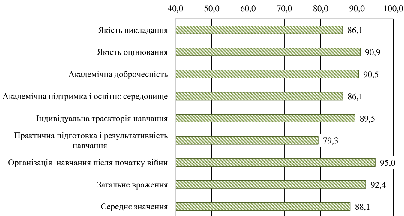
Рис. 3. Рівень задоволеності якістю ОП здобувачів вищої освіти магістратури за блоками питань (у % від кількості респондентів)

Анкета містить 40 запитань, 8 блоків. Високу задоволеність виявлено за всіма блоками питань; найвищі оцінки – у блоці «Організація навчання після початку війни» (95,0 %) та «Загальне враження» (92,4 %); найменша оцінка – у блоці «Практична підготовка і результативність навчання» (79,3 %) (рис 3).