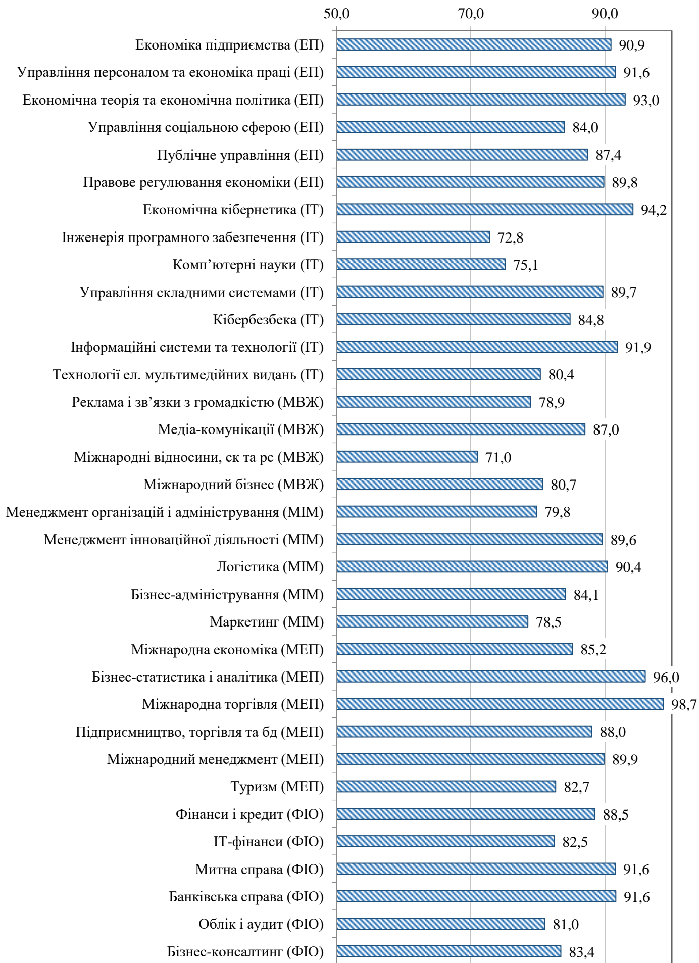
Рис. 2. Оцінки задоволеності якістю освітніх програм бакалаврату, (у % від кількості респондентів)