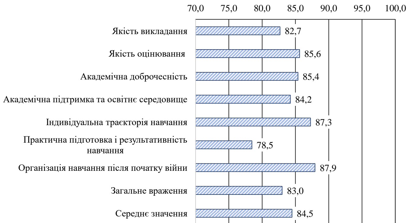
Рис. 1. Рівень задоволеності якістю ОП здобувачів вищої освіти бакалаврату за блоками питань (у % від кількості респондентів)

Анкета містить 40 запитань, 8 блоків питань У блоках питань «Навчання після початку війни» та «Індивідуальна траєкторія навчання» оцінки задоволеності виявилися вищими, ніж у інших блоках; у блоці «Практична підготовка і результативність» навчання оцінка нижче за інші блоки (рис.1).